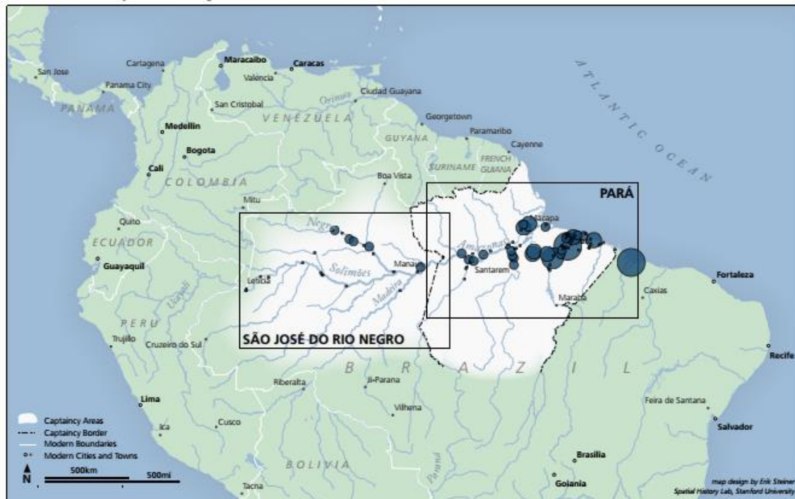
Figura 1: Localização da Capitania de São José do Rio Negro (XVIII-XIX)

Fonte: ROLLER, H. F. Colonial Routes : spatial mobility and community formation in the Portuguese Amazon. PhD Dissertation in History. Stanford University, 2010.