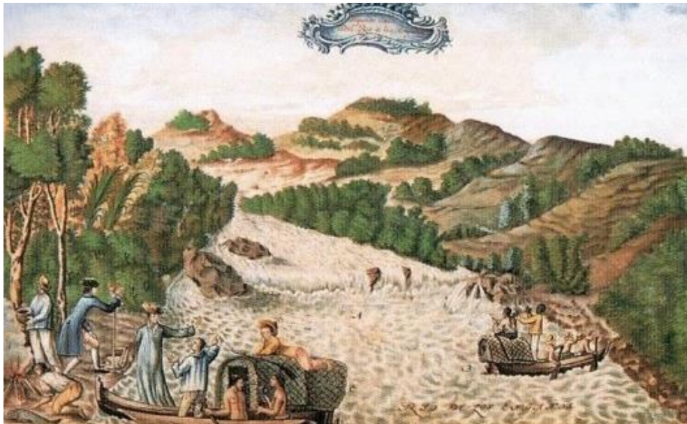
Figura 3: “Segundo Salto del río de los Engaños” de Francisco Requena

Fonte: produzida por Francisco Requena, localizada na Biblioteca Oliveira Lima da Catholic University of America , em Washington DC, reproduzida em http://www.vitruvius.com.br/revistas/read/arquitextos/13.148/4506