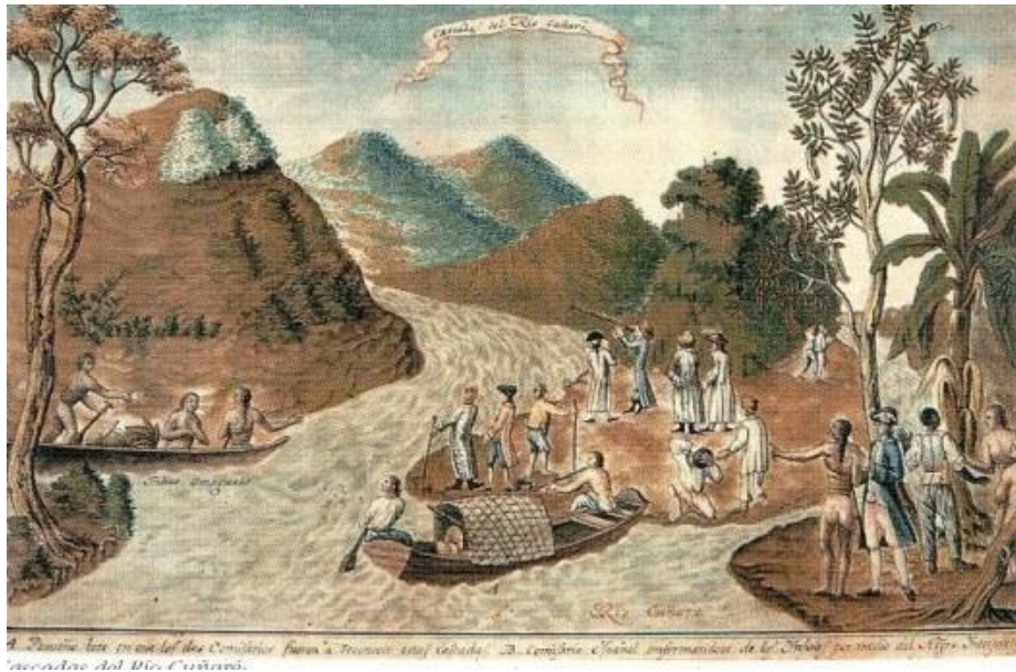
Figura 4: “Cascadas del Río Cunaré” de Francisco Requena